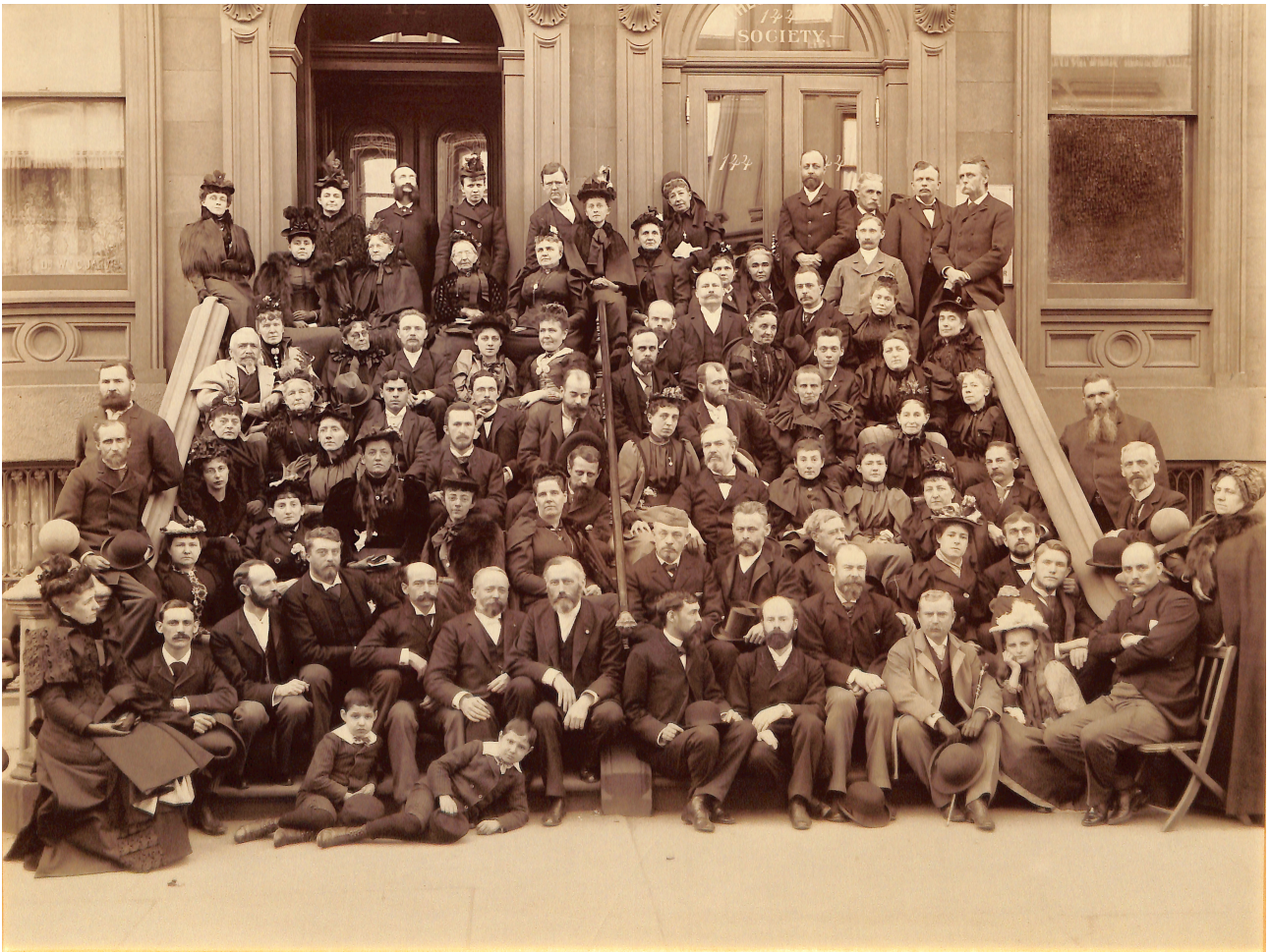
Theosophische Gesellschaft Amerika unterste Reihe, 7. v.l. William Q. Judge